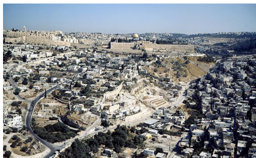
איור 1: תמונת עיר דוד בירושלים